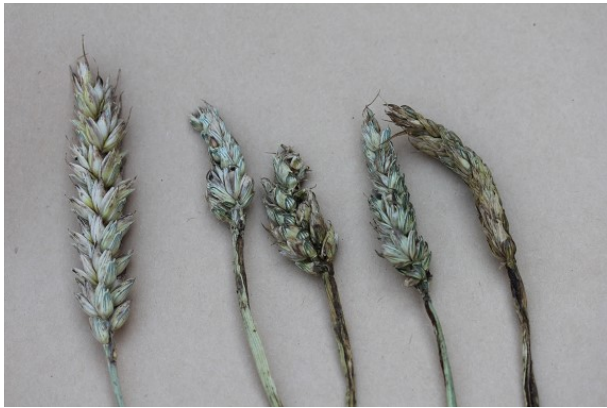
Billede 3. Angreb af bygfluier i vårhvede. Sundt aks til venstre.