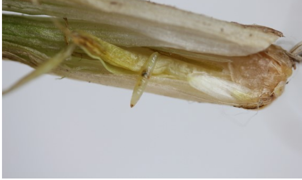
Billede 2. Bygfluens larve i stængel.